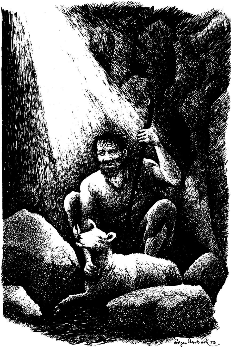
Roger Asbacks tegning av Finn-Pål med en stjålet sau.